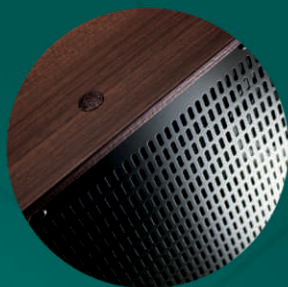
Toque sofisticado acabamento em madeira e telar diferenciado