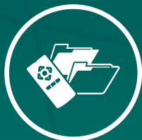
Controle Remoto c/ Troca de Pastas