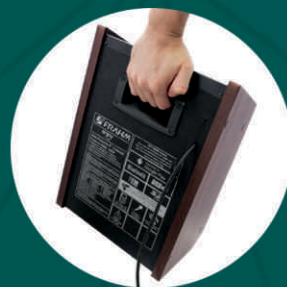
Alça para transporte