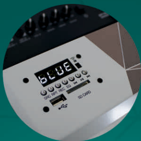
Display digital com LED branco