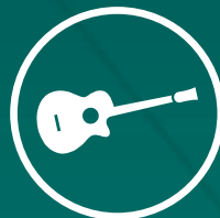
Violão e Guitarra