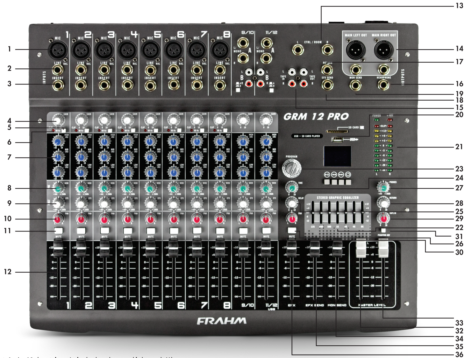
Imagem meramente ilustrativa. A posição dos controles e o visual mudam de acordo com o modelo de mesa adquirido.