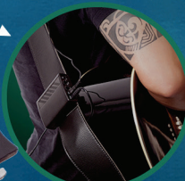
TRANSMISSOR WIRELESS UHF PARA MICROFONE E INSTRUMENTOS