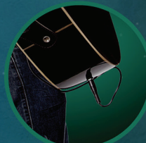
CABO PARA CONEXÃO DO INSTRUMENTO