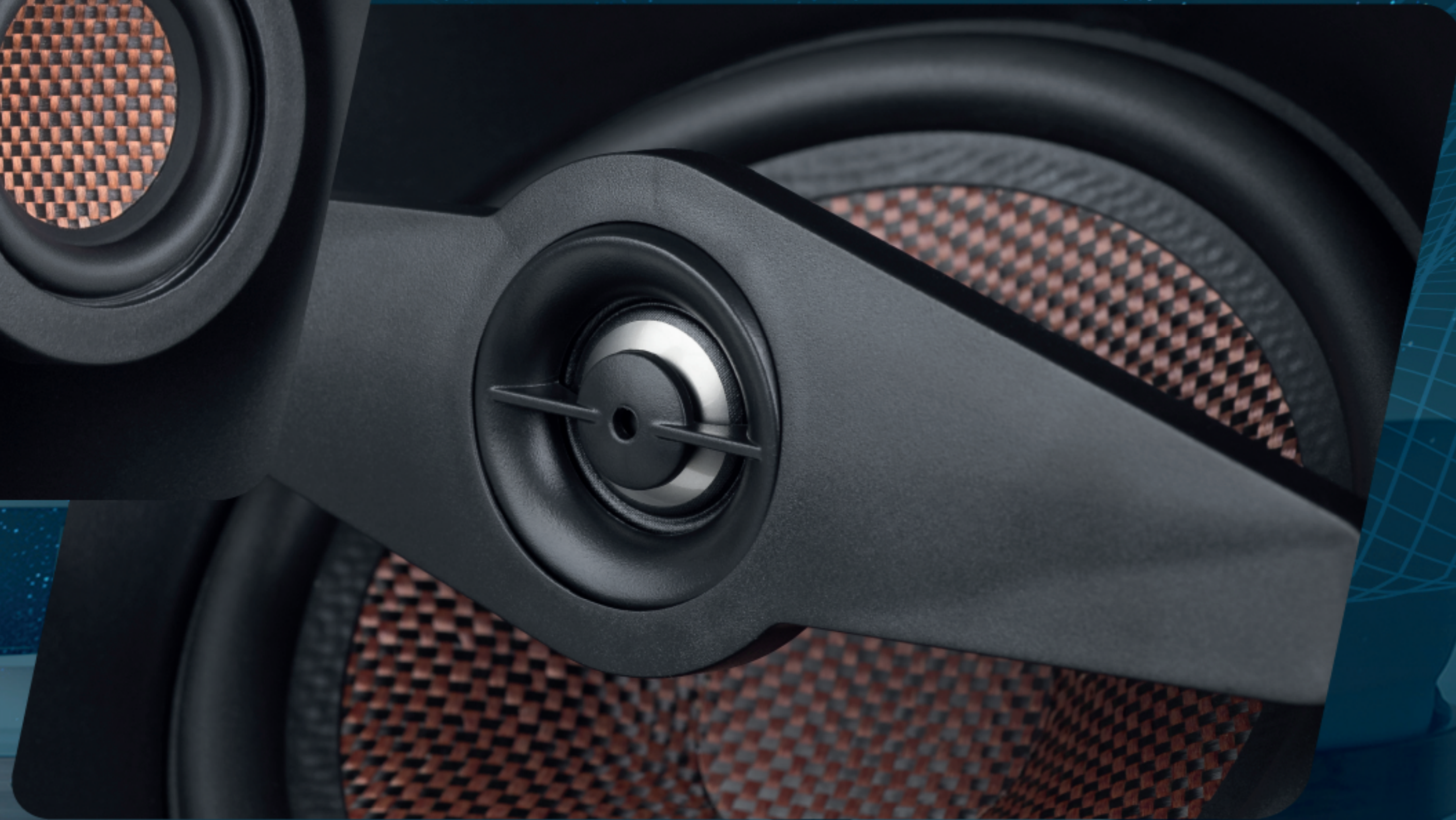
02 VIAS ANGULADA 100W