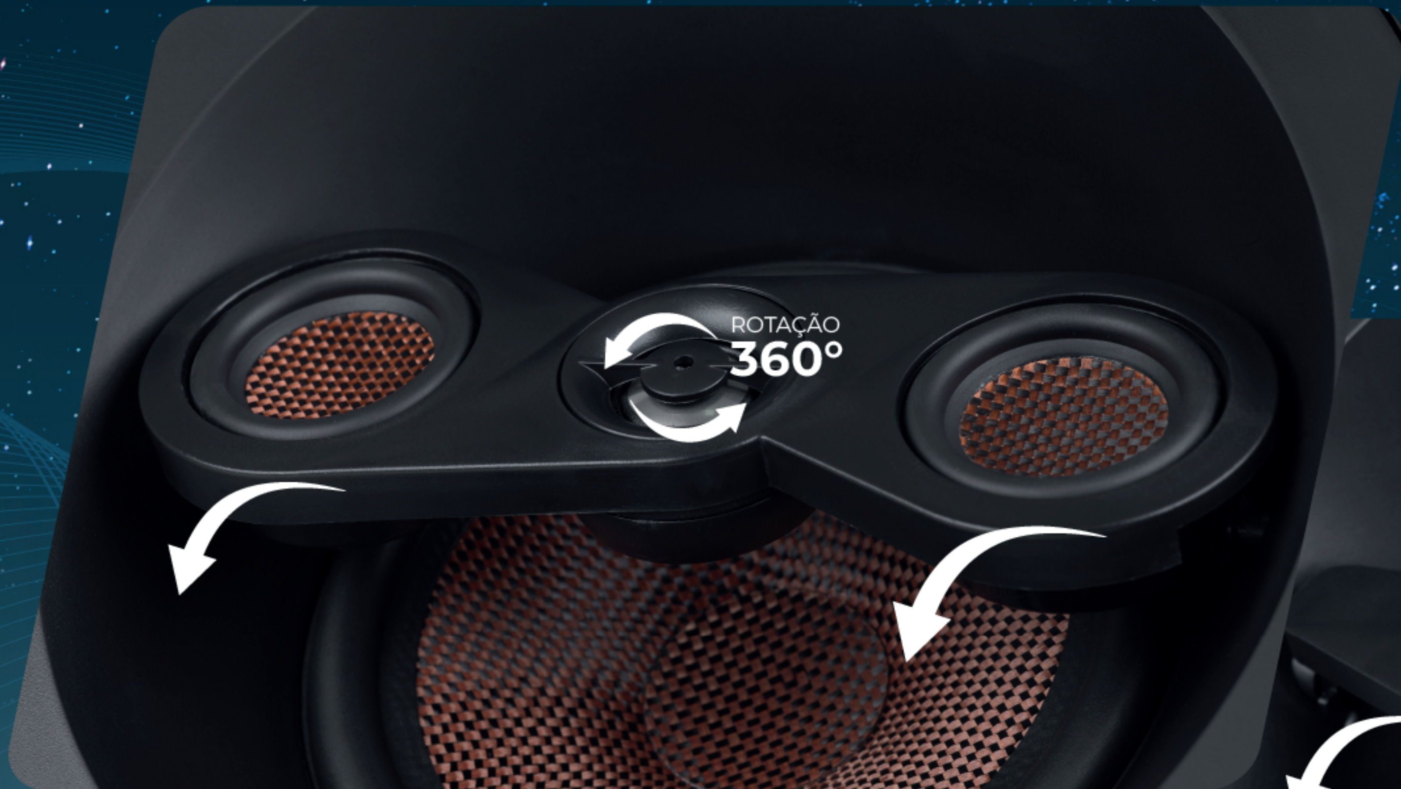
03 VIAS ANGULADA 100W