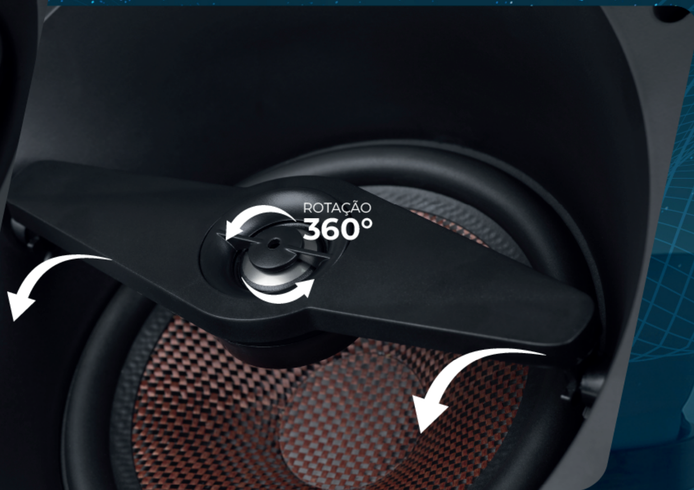
02 VIAS ANGULADA 100W