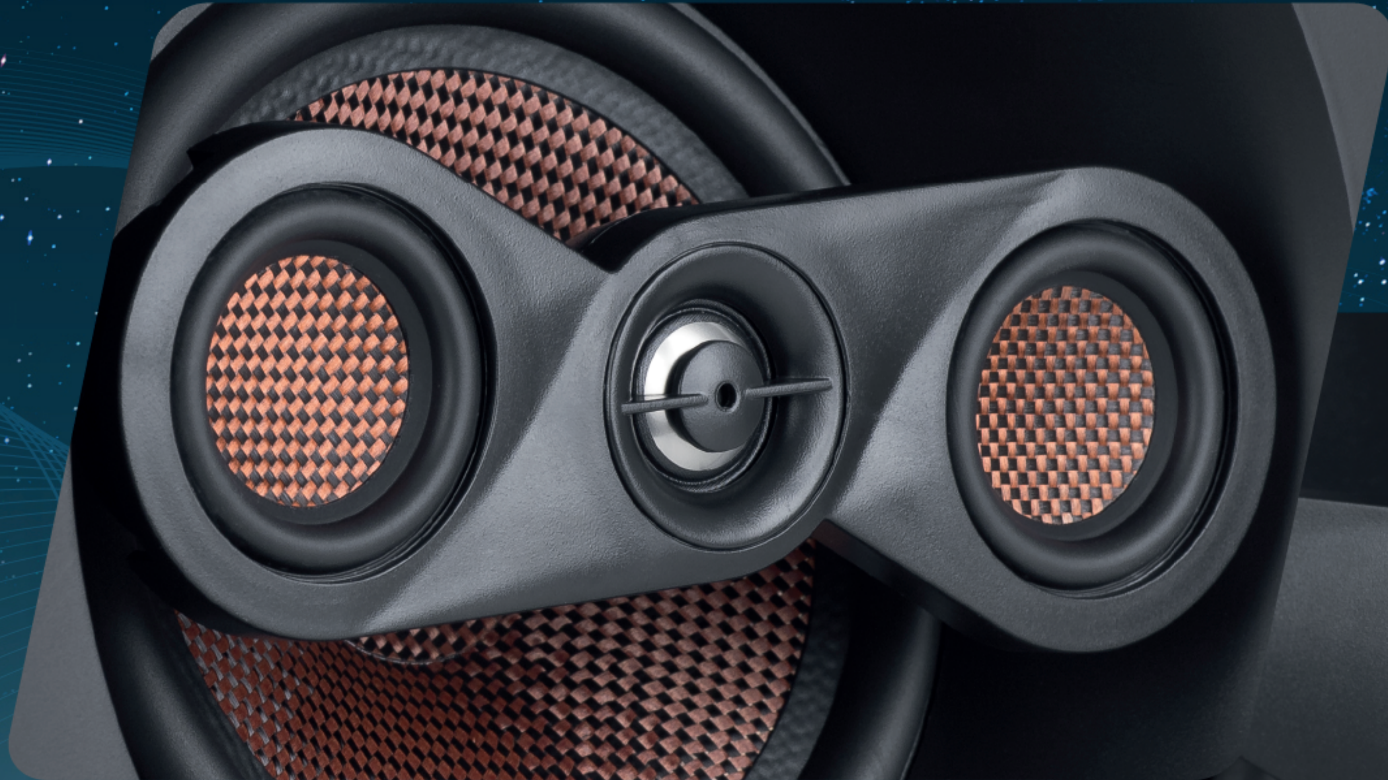
03 VIAS ANGULADA 100W